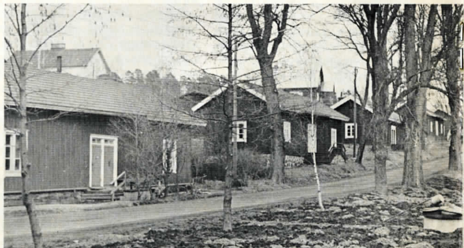
Bruksgatan i Fiskars.