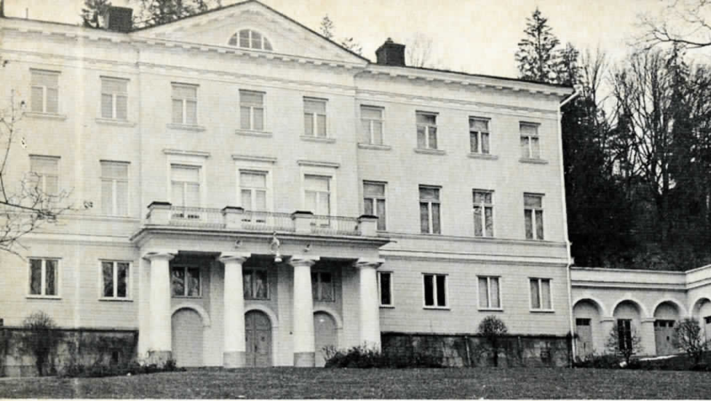
Det s.k. "Stenhuset", Fiskars corps-de-logi, ritat av C. Bassi 1815.

Vi är ca 700 som bor här. Man trivs eller trivs inte, beroende på omständigheterna, precis som på alla andra ställen, men jag tror inte att någon Fiskarsbo, oberoende om han bott här i tio generationer eller tio dagar någonsin är oemottaglig och likgiltig för den stämning som finns på detta gamla bruk där natur och kultur bildar en så harmonisk enhet. Med Fiskarsmått är jag själv ganska nyinflyttad, 10 år här, och trots att den första förälskelsen i någon mån gått över, måste jag fortfarande lägga band på mig för att inte låta alltför ansträngande entusiastisk när jag guidar besökare. Jag måste då komma ihåg att Fiskars en höstkväll kan vara avskryvärt, leriga vägar med svag och snål belysning och svart som i säcken utanför vägnätet, forsens eviga våta och kalla plaskande, tornklockans ödsliga klang, inte en människa ute, mössen som högljutt krafsar sig fram bakom tapeterna – då är idyllen långt borta.