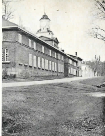
Stallkomplexet med klocktornet. Klockan är ett Könniurverk, 130 år gammalt.