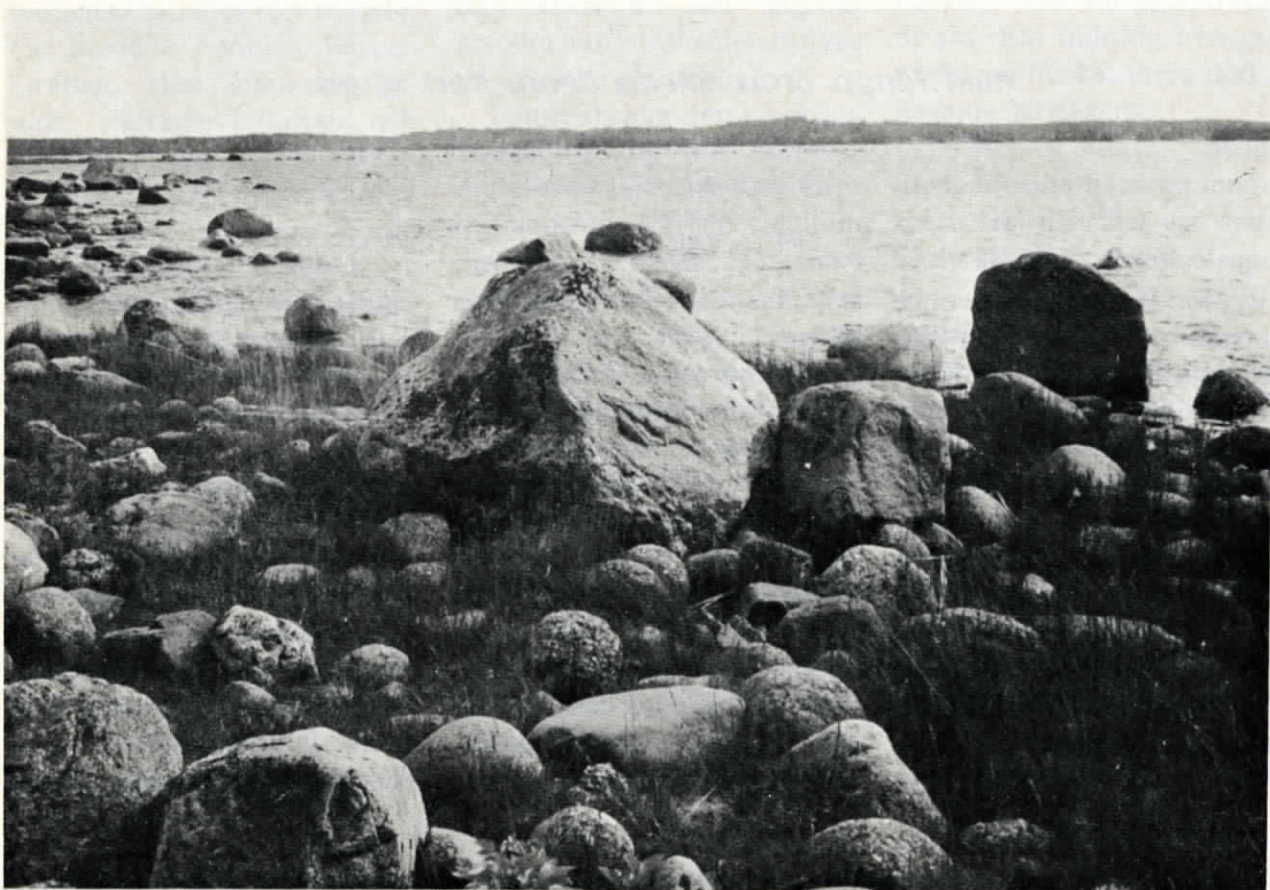
Stenig strand. Pellingelandet i bakgrunden